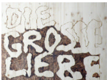
Anna Jermolaewa, Untitled , 2008. Pyrografie.

„Ars 01“, Museum of Contemporary Art Kiasma, Helsinki