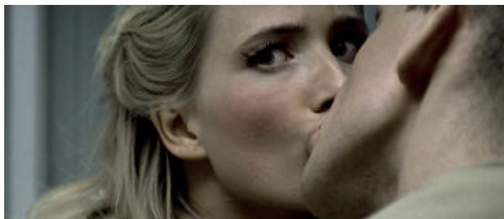
Jesper Just, SOMETHING TO LOVE . 2005. Video.

Wie kaum ein anderer Begriff erzeugt Liebe Bilder und Räume der Emotionen. Liebe ist ein Symbol für Kraft und Leere, Sucht und Verweigerung, Lust und Zerstörung. Liebe kennt kein Außen, ist ein Regime der Innerlichkeit, dessen Begehren sich in der Auslöschung des Liebesobjekts freisetzen lässt. Liebe ist eine Subjektivierungsmaschine, jeder entwirft sich und sein Gegenüber selbst, insofern kann das geheimnisvolle Potential der Liebe gerade im Alltag entwickelt werden. Anhand sechs exemplarischer künstlerischer Positionen unternimmt (LOVE) WILL TEAR US den Versuch, realen und phasmagorischen Spiegelungen des Liebesbegriffs nachzugehen.