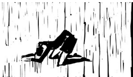
Aksel Zeydan Göz, Simone , 2005. Video.

2006 „CUMULUS Prize“, European way(s) of Life, Nantes